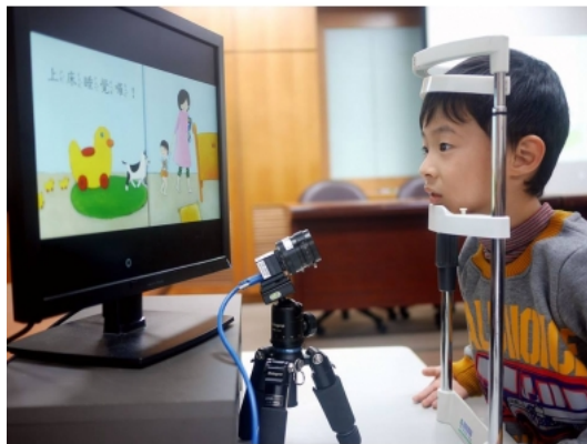
臺師大研發「自然光眼動儀」有助提升長輩,兒童閱讀經驗

若是小朋友只要動動眼睛,盯著螢幕看到不懂的字,停留一下就能自動發出字詞聲音,甚至產生動畫和圖表來說明,這樣的電子書將更有效率!國立臺灣師範大學跨領域團隊,共同研發「眼動電子書」,技術領先業界,且透過「自然光」就可進行眼動偵測,系統即時分析使用者閱讀時的眼動行為,未來可適時輔助長輩和兒童使用。