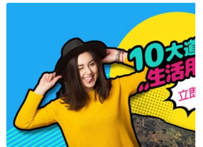
你的英文讓外國人滿臉問號？行語這裡看▶ TutorABC Sponsored