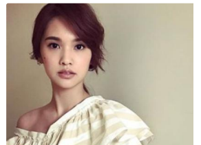
楊丞琳赴英 行李遺失「衣服」 三立新聞網 setn.com