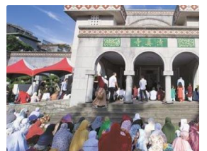
土國捐清真寺 柯P訪歐親自談 中時電子報