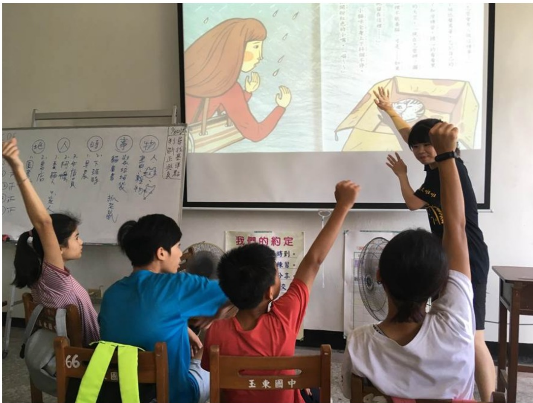
有志從事偏鄉教育的大學生，在暑假中發揮所學，輔導71位花蓮偏鄉國中生。